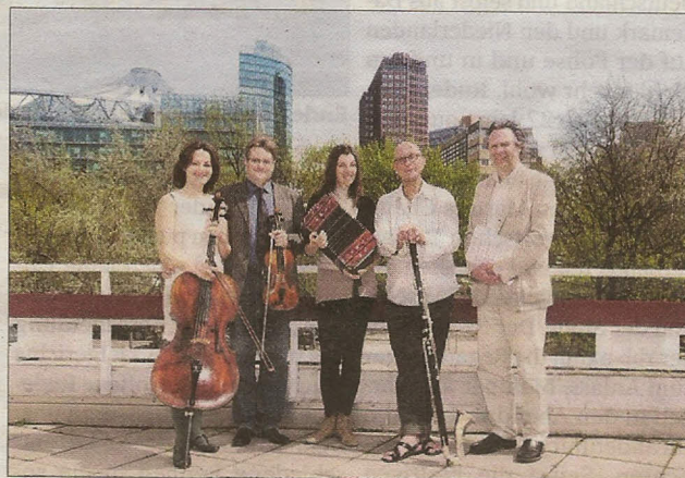
„Les Seraphines“ spielen zur Vernissage am 18. Juli.