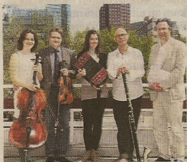
Das Quintett musiziert am Sonnabend in Töplitz